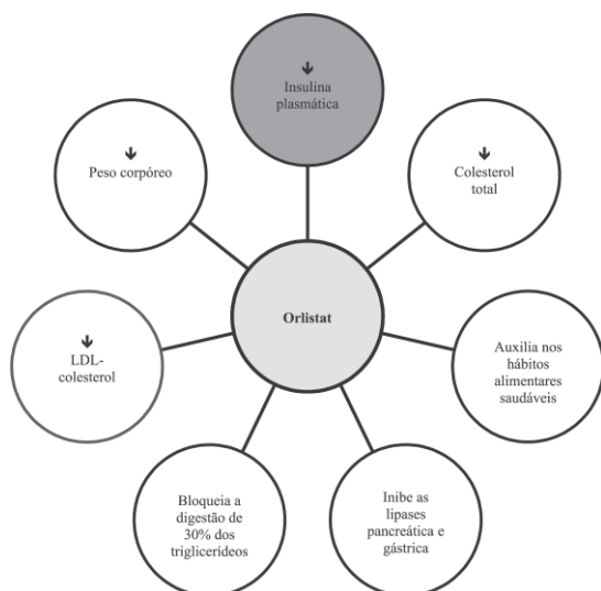
Figura 3 - Efeitos do orlistat.

Segundo o Consenso Latino-Americano de Obesidade, a dietilpropiona, o femproporex e o mazindol fazem parte de medicações que podem ser usadas em pacientes que não possuem condições de utilizar orlistat e/ou sibutramina,